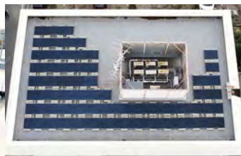
屋上の太陽光パネルを空からみると……