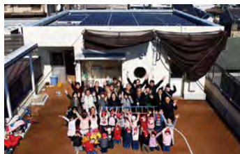
保育園におひさま発電所ができた！