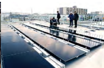
工場の屋上に並んだ太陽光パネル