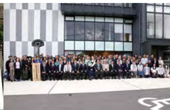
25ヶ所目のおひさま発電所です